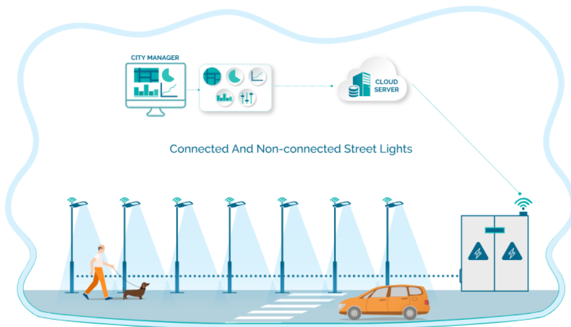
Slika 1. Slikoviti prikaz sustava vanjske rasvjete

Planovi predstavljaju podloge za projekte vanjske rasvjete i izradu Akcijskog plana. Bitno je razvoj rasvjete usmjeriti i uskladiti s zakonom o zaštiti od svjetlosnog onečišćenja. Najvažnije komponente vanjske rasvjete koje bitno utječu na provedbu zakona prikazani su na slici ispod.